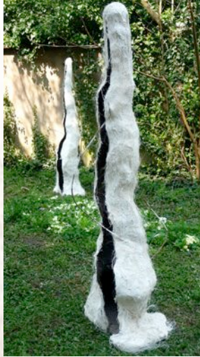
3 bicoques en croute